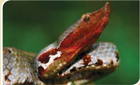
கிரேஸ் கோப்பி விரியன் - ( Hypnale zara )