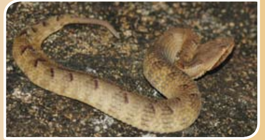
இலங்கையின் கோப்பி விரியன் - ( Hypnale nepa )