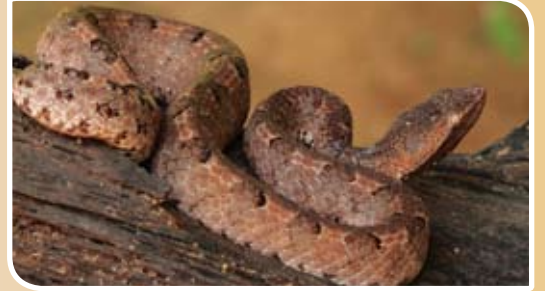
மெரம்ஸ் கோப்பி விரியன் - ( Hypnale hypnale )

இலங்கையில் பதிவுசெய்யப்பட்டுள்ள 85 நிலப் பாம்பு இனங்களில், மரணத்தை ஏற்படுத்தும் விஷத்தை 5 பாம்புகள் மட்டுமே கொண்டுள்ளன.