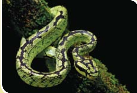
பட்டைக் குழி விரியன் - ( Trimeresurus trigonocephalus )

நடுத்தர நஞ்சுத்தன்மையிலான பாம்புகள் கடிக்கும் போது அவை வழமையாக மரணத்தை விளைவிக்காது என்பதுடன், நான்கு நடுத்தர நஞ்சுத்தன்மையிலான பாம்புகளை எதிர்நோக்குதல் அபூர்வமானதாகும். ஏனெனில், அவை வளங்களைச் சுற்றியே மிக அதிகளவில் காணப்படுகின்றன. எனினும், இந் நான்கில், வீடுகளுக்கு அருகில் இருட்டான இடங்களில் மெரம்ஸ் கோப்பி விரியன் அடிக்கடி காணப்படுகின்றது. இலங்கையில் பாம்பினால் கடிக்கப்படும் சம்பவங்களில் ஆகக்கூடுதலான எண்ணிக்கைக்கு கோப்பி விரியன் பொறுப்பாகும். அதன் விஷத்தின் நச்சுத்தன்மை மீதான அடிப்படையில், அது சாந்தமான நச்சுத்தன்மையிலானது என மிகவும் பொருத்தமானவிதத்தில் வகைப்படுத்தப்பட்டுள்ளது. எனினும், கொத்திய பின்னர் சரியான சிகிச்சை கொடுக்கப்படாவிடின் விரியனின் விஷம் குறுதி உறைதலை பாதித்து மரணத்தை விளைவிக்க கூடும். ஆதலால் மிகவுயர்ந்தளவில் நச்சுத்தன்மையிலான பாம்பொன்றாக இலங்கை மருத்துவச் சங்கத்தின் பாம்பு கடித்தல் குழு கோப்பி விரியனை வகைப்படுத்தியுள்ளது.